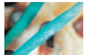
青くなった胚軸（写真②）