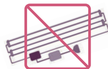
外部電極蛍光管等