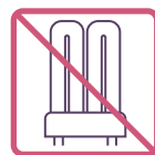
コンパクト形蛍光灯