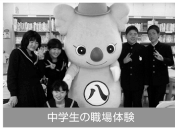
中学生の職場体験