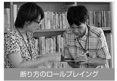
断り方のロールプレイング